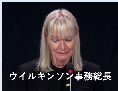
ウイルキンソン事務総長